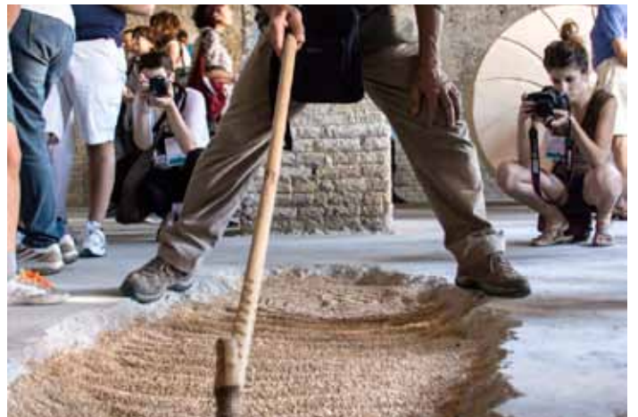
Trekking Urbano Ravenna Città d'acque, 2013 (Molino Lovatelli)