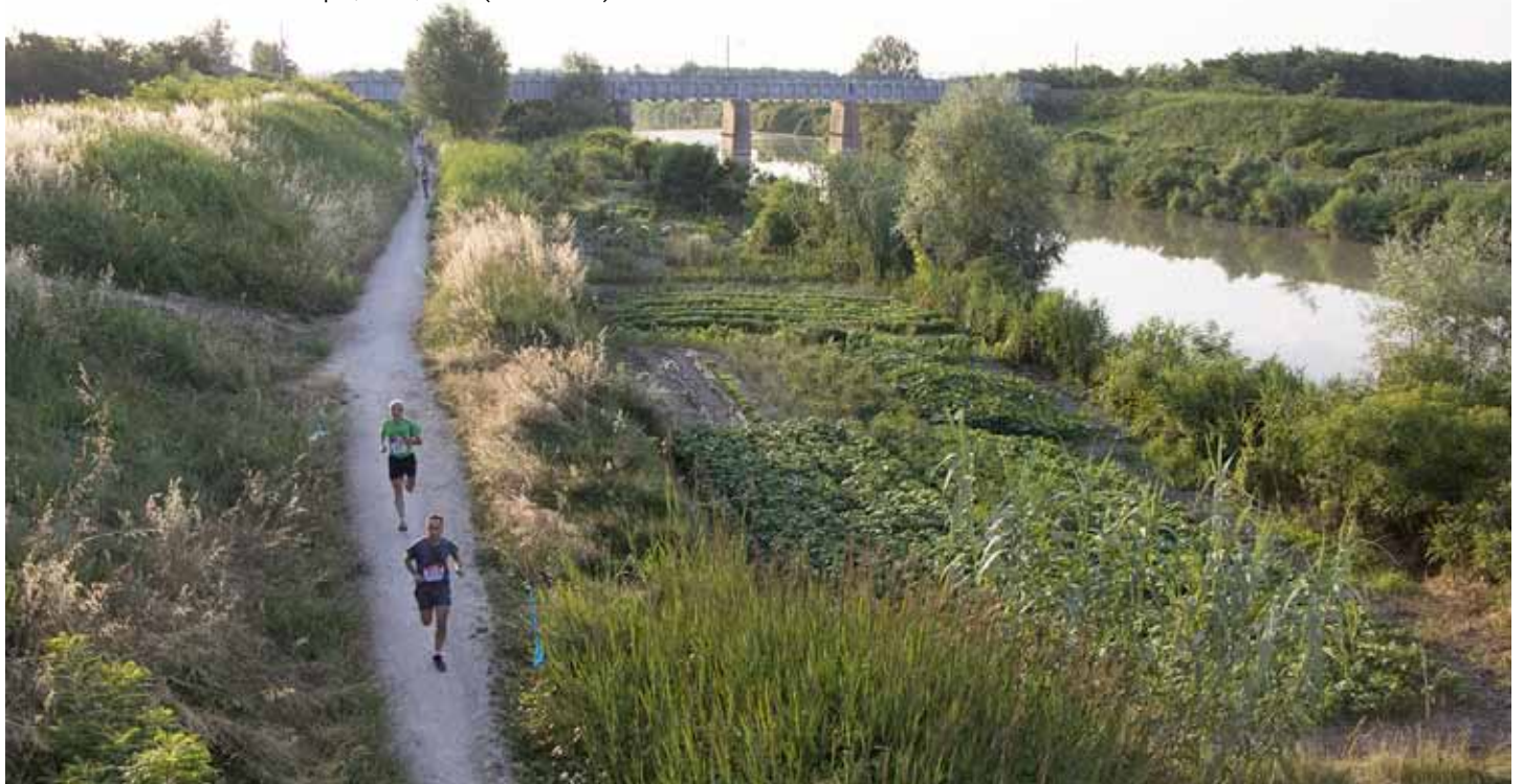
Urban Trail Ravenna Città d'acque, 2013, 2104 (Fiumi Uniti)