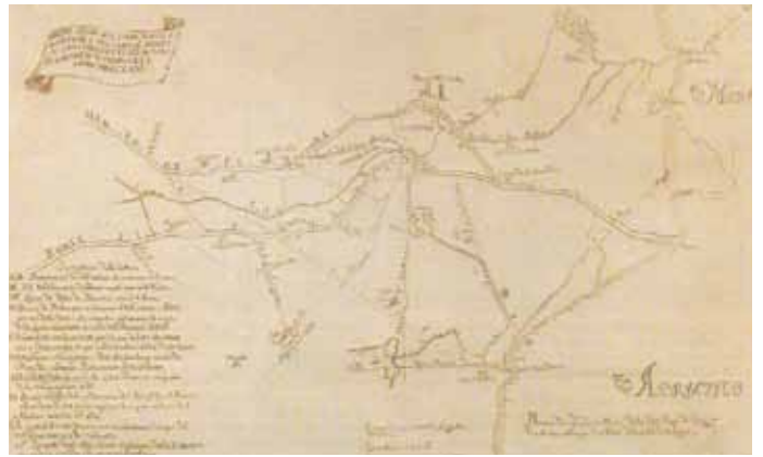
Bernardino Zandrini 1731, progetto di diversione e rettificazione di Ronco e Montone utilizzando la bocca del porto canale pamphilio

Una festa del fiume e della città perché ora i Fiumi Uniti non scorrono ad oltre due chilometri da Ravenna, ma ne sono parte integrante, un 'ponte' che collega il centro al mare. Un 'parco fluviale' su cui la Città tutta dovrebbe investire perché ricco di potenzialità costituendo un percorso naturale dalla Città d'Arte al mare, alle dune, alle pinete ravennati. Un itinerario percorribile a piedi e in bici – come fanno tanti ravennati ogni giorno – ma anche in canoa. Sono numerosissime le associazioni che hanno aderito a questo progetto che vuole al tempo stesso sottolineare l'importanza dello sport in natura, della cultura del territorio e delle sue tradizioni. Un movimento che attiva ampie sinergie esprimendo al meglio le potenzialità dei singoli soggetti dimostrando che lo sport è democrazia, capacità di aggregazione e salute, ma che può anche divenire volano di sviluppo e costruzione consapevole del futuro.