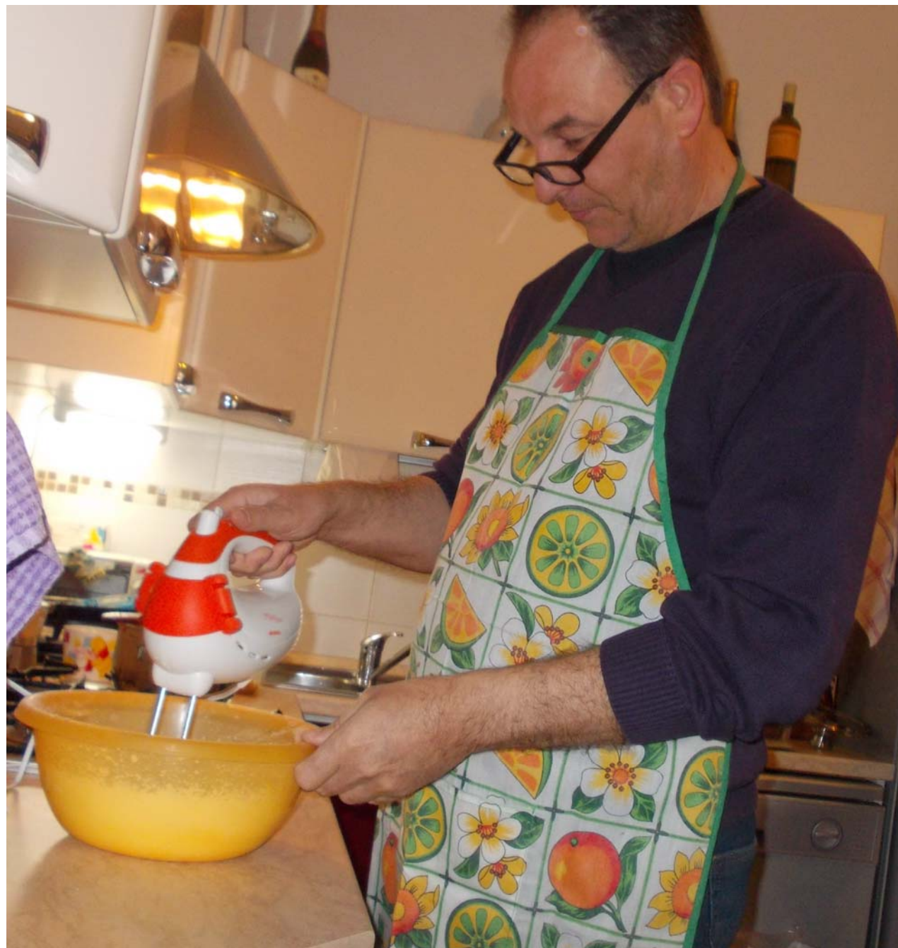
Scuola Primaria “Bartolotti” Savarna – Istituto Valgimigli

Ho scelto questa foto, che rappresenta mio babbo mentre prepara un dolce, perché di solito sono le donne che preparano il dolce, ma, invece, stavolta l'ha fatto un uomo. Ed era anche molto gustoso!