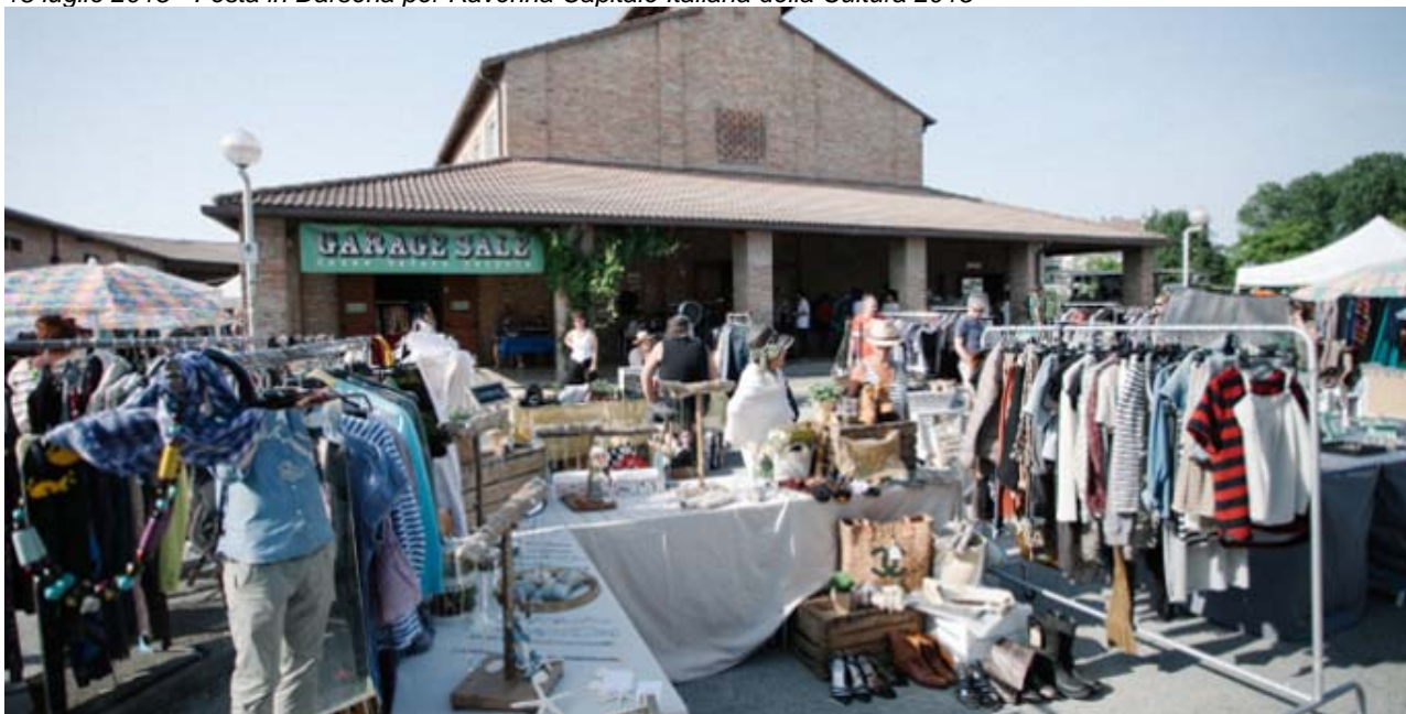
Ex Raffineria Almagià in Darsena – Evento periodico “Garage Sale”