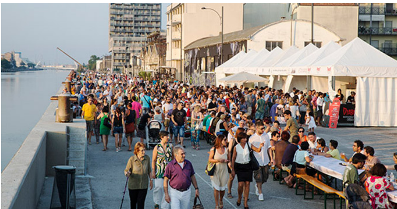
18 luglio 2015 - Festa in Darsena per Ravenna Capitale Italiana della Cultura 2015

Da alcuni mesi a questa parte, in particolare nella banchina in destra, la Darsena è diventata teatro di importanti eventi e iniziative, sono inoltre in itinere progetti e percorsi per usi temporanei atti al riuso di aree e alla riqualificazione e valorizzazione di alcuni episodi di archeologia industriale, che seguiranno al già effettuato recupero con utilizzo a fini culturali dell’ex magazzino dello zolfo “Almagià” e dell’Ex Tiro a Segno già oggetto da tempo di riuso con iniziative ed eventi culturali e ricreativi.