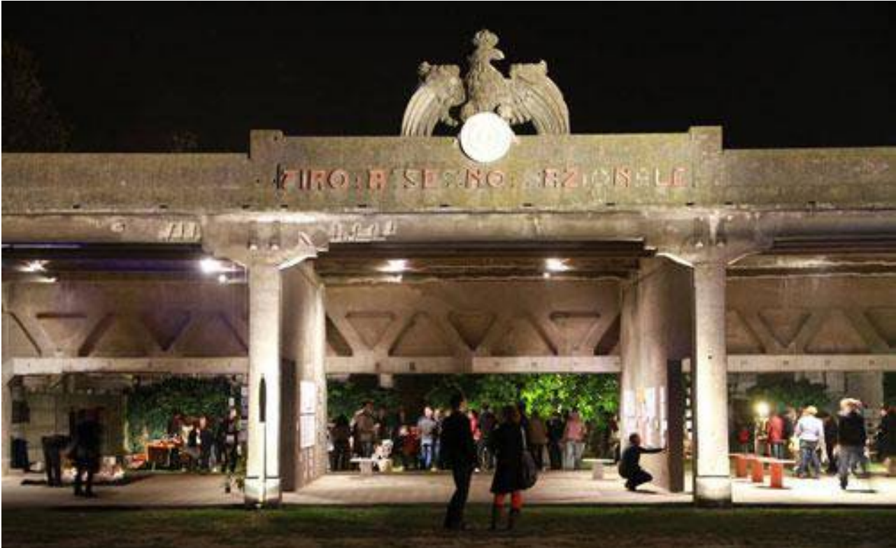
Ex Tiro a segno in Darsena – Evento periodico “Notte d’Oro”

Il POC Darsena quindi persegue la riqualificazione/riconversione di una rilevante e fondamentale parte di città ma, in particolare, persegue la riqualificazione/riconversione sostenibile di tale parte di città perché possa offrire spazi per attività culturali ed artistiche ma anche e soprattutto perché possa favorire la nascita di creative industries. La connessione tra cultura e rigenerazione urbana può e deve essere, nel caso della Darsena di città, una grande occasione per Ravenna e il tema degli usi temporanei può essere di grande aiuto per richiamare su di essa le sinergie, le attenzioni e la nuova vita che merita.