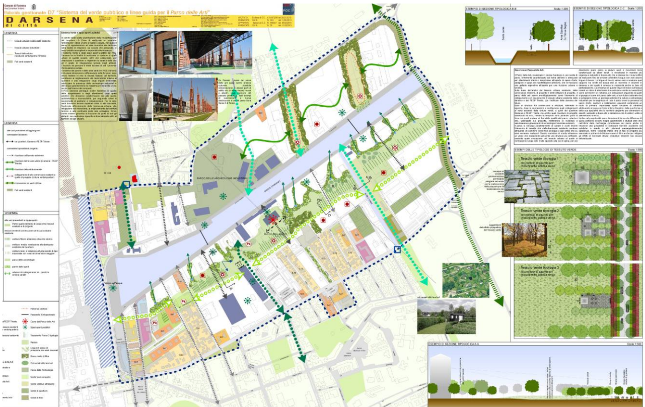
Tavola POC D7

- la caratterizzazione degli spazi per usi culturali, sportivi, ricreativi, turistici , sia attraverso il riuso del Canale Candiano, previa riqualificazione delle acque, quale primo elemento identificativo dei luoghi, utilizzando lo specchio d'acqua per spettacoli, cultura, sport, svago, ecc. sia mediante una macrodivisione in tre fasce funzionali del quartiere. La prima fascia verso città dovrà caratterizzarsi, quale passeggiata e luogo di ritrovo diurno e serale, per la presenza di attività commerciali, turistiche, pubblici esercizi. La fascia centrale, già caratterizzata dalla più suggestiva archeologia industriale, insieme alle frontistanti banchine e allo specchio d'acqua, saranno occasione per la realizzazione di un polo culturale unico per peculiarità architettoniche, scenografiche e di grande spettacolarità turistica. La terza fascia, in adiacenza all'ambito di transizione allo spazio urbano, ne caratterizza la vocazione per terziario servizi e nuove tecnologie a completamento e a supporto del vicino polo terziario De Andrè;