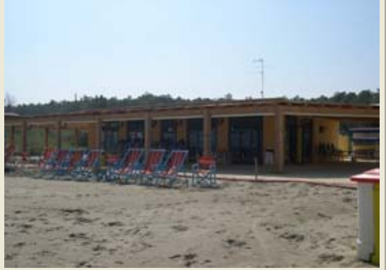
FOTO AREA DESTINATA ALLA BALNEAZIONE