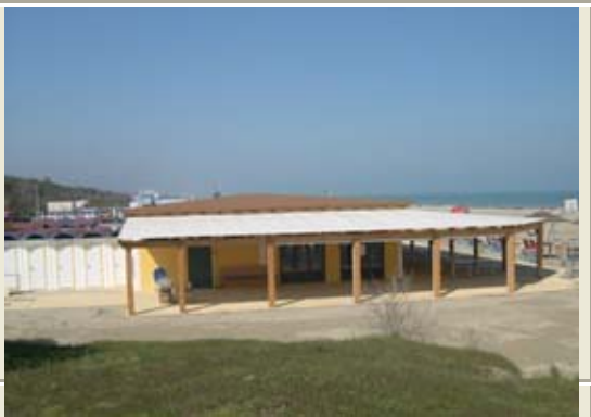
FOTO AREA A SUPPORTO DELLA BALNEAZIONE