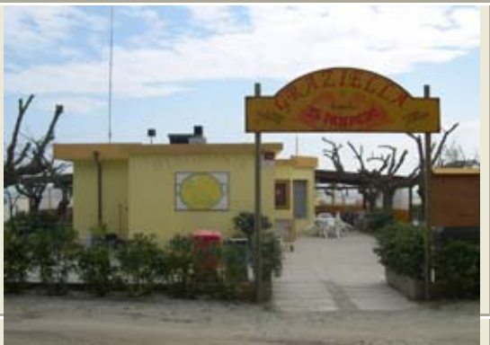
FOTO AREA A SUPPORTO DELLA BALNEAZIONE