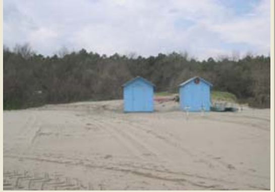
FOTO AREA DESTINATA ALLA BALNEAZIONE