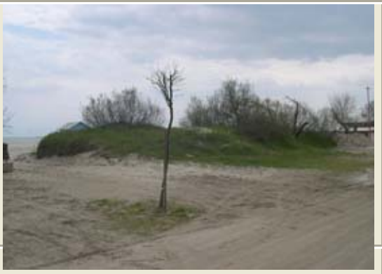
FOTO AREA A SUPPORTO DELLA BALNEAZIONE