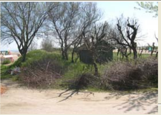
FOTO AREA A SUPPORTO DELLA BALNEAZIONE