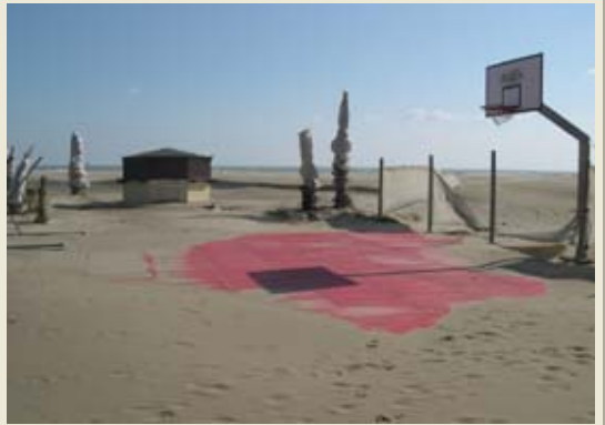
FOTO AREA DESTINATA ALLA BALNEAZIONE