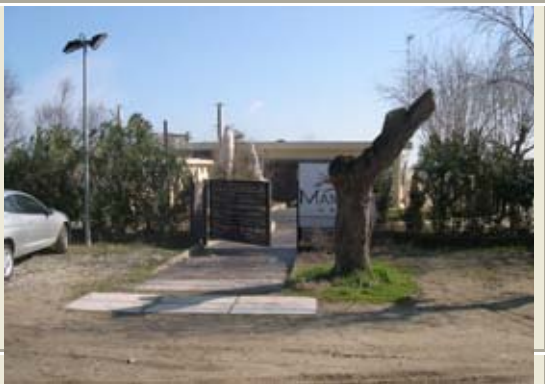
FOTO AREA A SUPPORTO DELLA BALNEAZIONE