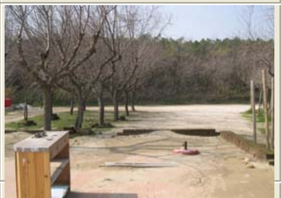
FOTO AREA A SUPPORTO DELLA BALNEAZIONE