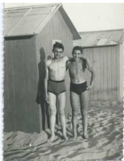
Punta Marina, estate 1958