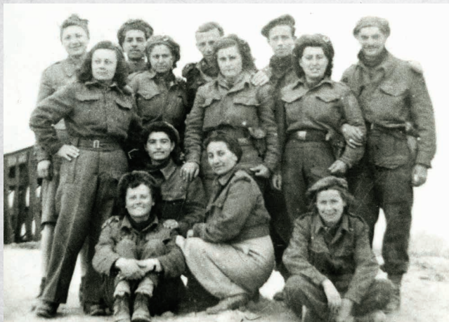
Partigiane e partigiani della 28a Brigata Garibaldi "Mario Gordini"

Vita di Don Minzoni , lettura realizzata dalle ragazze e ragazzi della scuola secondaria di primo grado " Don Giovanni Minzoni " con la partecipazione dell' Orchestra della scuola , a cura di Ravenna Teatro in collaborazione con l'Istituto Storico della Resistenza e dell'Età contemporanea di Ravenna e provincia