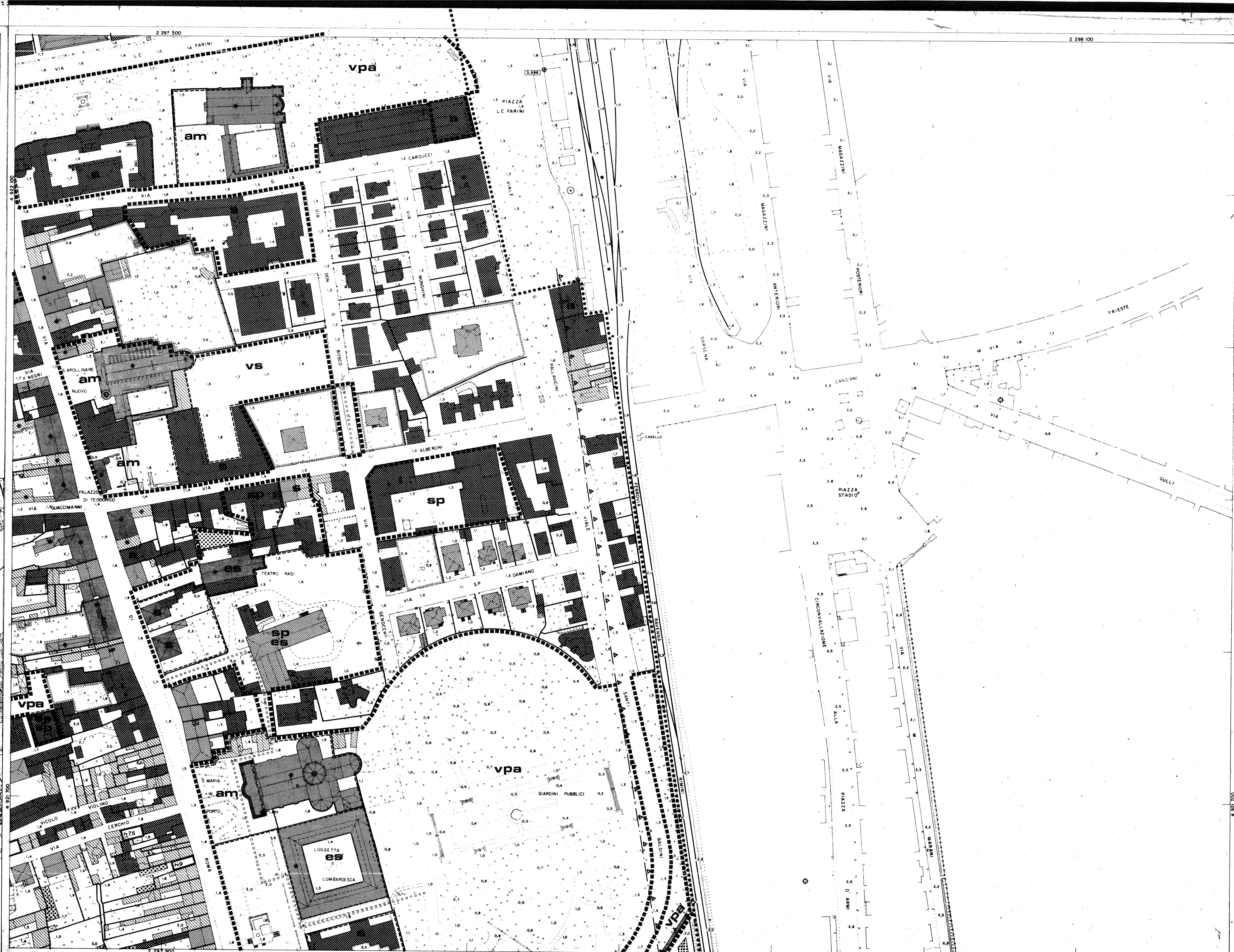
RILIEVO DEL 1979