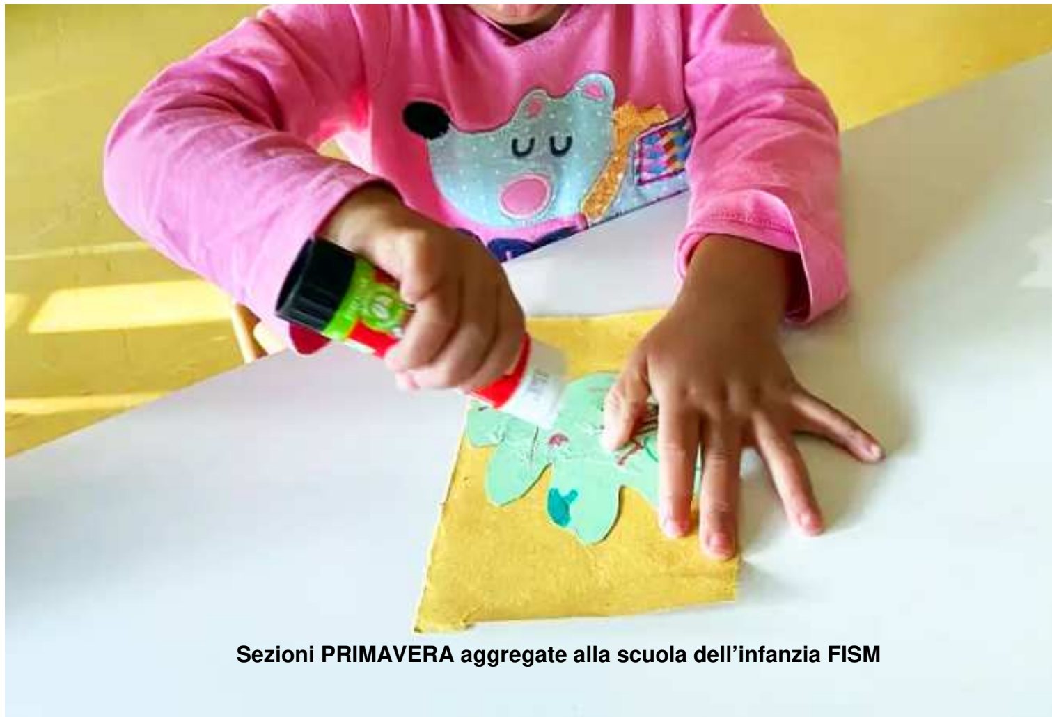
Sezioni PRIMAVERA aggregate alla scuola dell'infanzia FISM